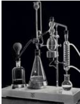
Измеритель кислотности ДЖАФФМАН