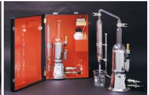
Измерители кислотности ИОЦЦИ