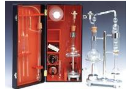
Измеритель кислотности БЕЛОКС